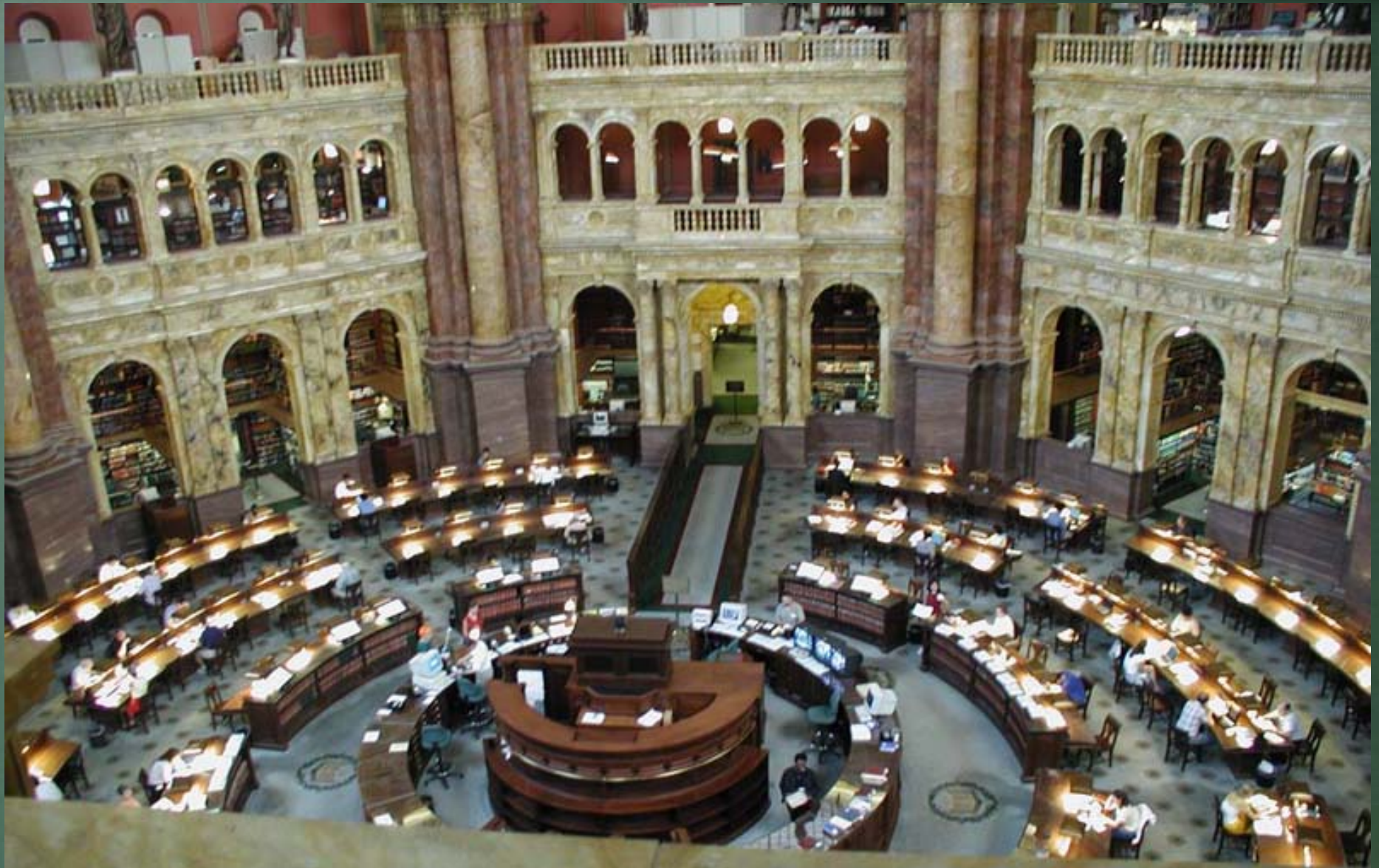
Lesesaal der Library of Congress (Washington, D. C.)